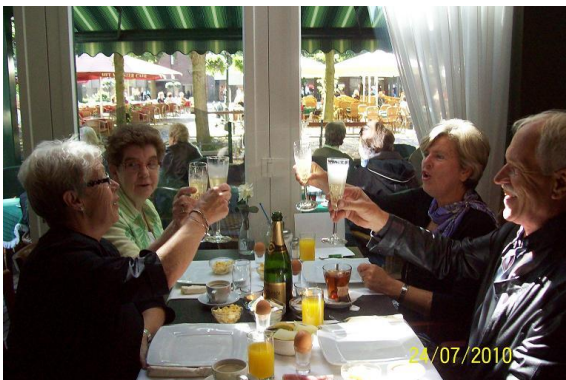
De prachtige gift van de firma Doekemeijer

In het financieel verslag, dat als bijlage aan deze Nieuwsbrief wordt toegevoegd, is te zien dat de Stichting inmiddels over een mooi bedrag kan beschikken. Dit is voor een heel groot deel te danken aan een gift van een bevriend echtpaar, eigenaar van de firma Doekemeijer. Zij hebben in 2010 tweemaal een bedrijfsfeest gegeven: één voor hun leveranciers en klanten en de andere voor het personeel. De financiële giften die zij hierbij ontvingen, zijn door hen verdubbeld en deze verdubbeling is aan de Stichting Ida-Mabogini geschonken. We waren helemaal perplex en buitengewoon dankbaar voor deze schenking.